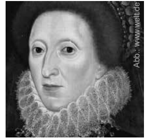
Elisabeth, die „jungfräuliche“ Königin

Und ausgerechnet dieses Verbrechen spielte der Sohn Marlowe schon drei Wochen später, am 6. Januar 1593, bei der weihnachtlichen Festaufführung am Dreikönigstag im Rahmen seines Stückes König Henry im Schloss „Hampton Court“ an der Themse nach – vor der anwesenden Königin! Es war unglaublich: Die Pembroke Players zeigten den Tod des Humphrey, Duke of Gloucester and Pembroke, auf der Bühne, und Marlowe selber sagte dazu den Text, der auf den Tod seines Vaters anspielte, weil er der Königin zeigen wollte, was für ein gemeines Spiel die Bischöfe seinerzeit, aber auch welch gemeines Spiel die Bischöfe, speziell der Erzbischof von Canterbury, bei dem Tod seines Vaters erst drei Wochen zuvor gespielt hatten.