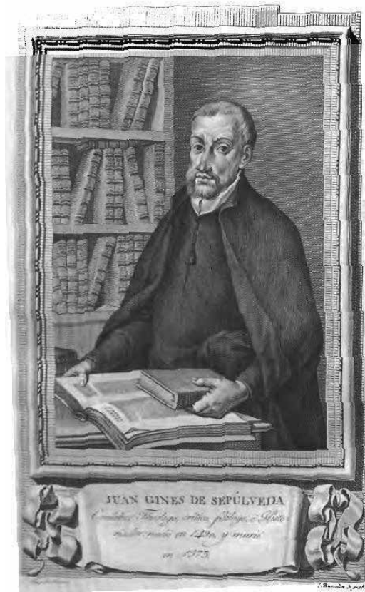
Juan Ginés de Sepúlveda (1490 - 1573) verteidigte als spanischer Humanist, Historiker und Übersetzer überraschenderweise das Recht Spaniens, Krieg zu führen und die Indios zu versklaven, begründet mit einer behaupteten Inferiorität im Vergleich zu anderen Menschen.