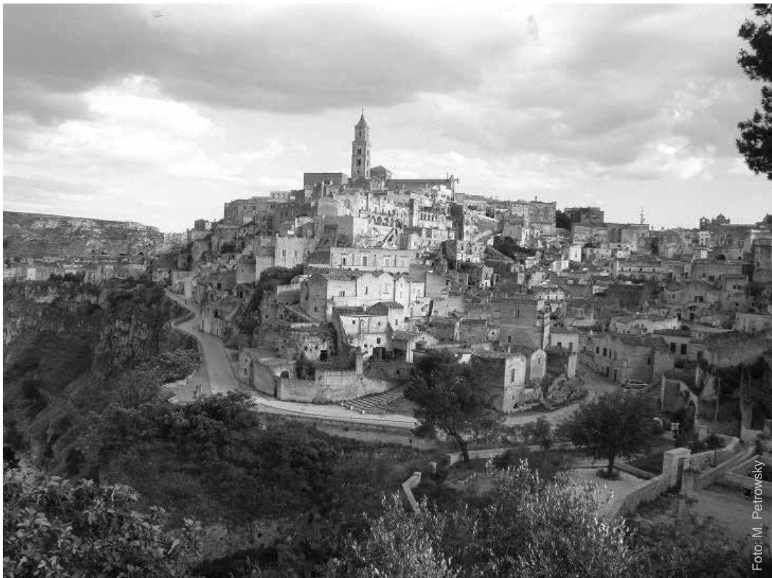
Matera – europäische Kulturhauptstadt 2019 Ein faszinierendes Modell für modernes Leben in harmonisch gewachsenem Ambiente.

den nie aus dem Auge verlieren. Denn jeder von uns ist auch Europäer, und wir wollen versuchen, möglichst gute Europäer zu werden. Das tut in Zeiten zunehmender Skepsis gegen Europa, obwohl wir in Sicherheit und Wohlstand leben, um die uns die restliche Welt beneidet, unbedingt not. Die verheerenden Konsequenzen unsachlicher EU-Kritik, wie sie die britische Boulevardpresse über Jahrzehnte betrieben hat, muss das Vereinigte Königreich nun am eigenen Leib erfahren. Die Schockwellen sind in der ganzen EU zu spüren. Die europäische Solidarität muss gestärkt werden. Setzen wir uns mit allen Kräften dafür ein. Eigenständige nationale Identitäten und die Pflege unseres kulturellen Erbes erhalten unser Selbstwertgefühl und bereichern den gesamten Kontinent. Zu gutem Europäertum steht dies keineswegs im Widerspruch, es ist sehr gut damit vereinbar. Und macht uns zu besseren, bewussteren Europäern.