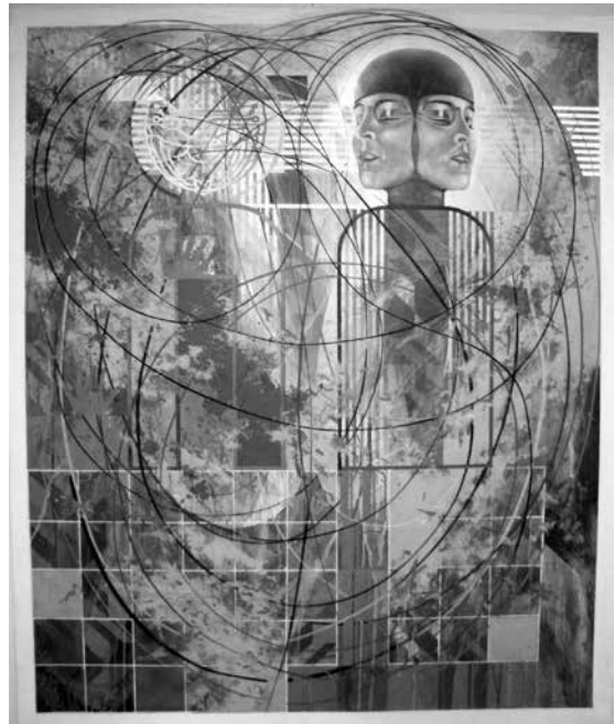
Ernst-Ferdinand Wondrusch: Metropolis , Acryl auf Leinwand

Schiele meinte, es gibt keine moderne Kunst, sondern nur gute, und das stimmt. Beuys sagte einmal: jeder Mensch ist ein Künstler. Leider ist das eine eigenwillige Deutung eines Zitats von Novalis, der eigentlich sagte: Mensch zu werden ist eine Kunst!