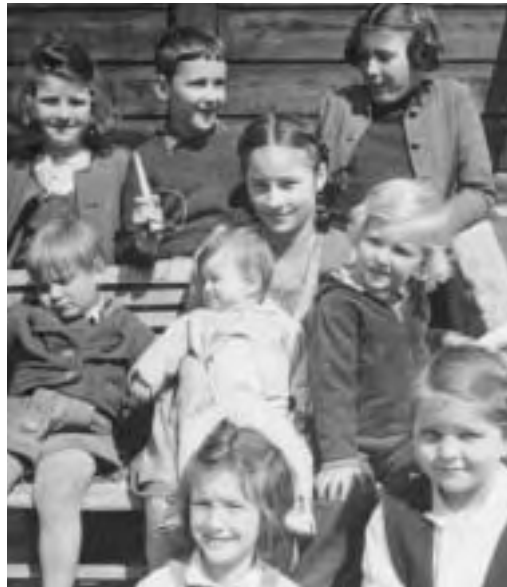
Im Buch verewigt; Kritzendorfer Kinderrunde, 1950

„Die Angst verflog, als es Ingeborg gelang, dem Führer die erste, sehr steile und knappe Schleife sturzfrei nachzufahren. Das war ja ein herrliches Terrain, eine ganz dünne Schicht Pulver auf harter Grundlage, und auch dort, wo man plötzlich in tiefen Schnee kam, durchschnitten ihn die Bretter, als wär's gewichtloser Schaum!“ (S. 199 f.)