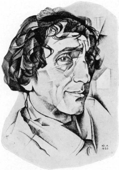
Н. Н. Евреинов

Портрет работы Ю. Анненкова. Петроград, 1920 г.