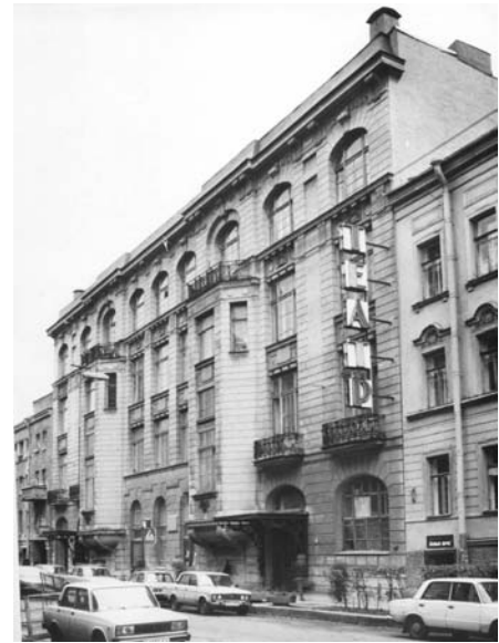
Das Theater „Kornödie“ in St. Petersburg – seit 1914 kaum verändert.