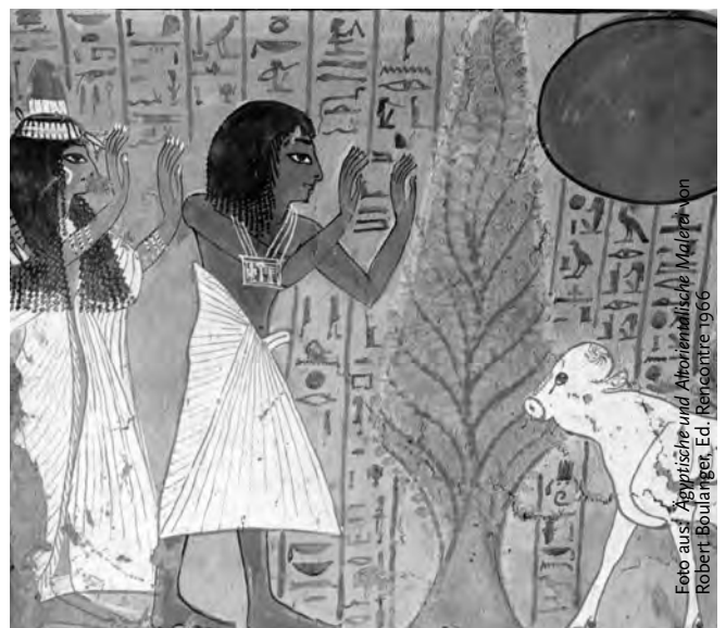
Theben, Grabkammer der Arinefer: Sonnenanbetung

Unzählige Hieroglyphen-Texte an Pyramiden- und Tempelwänden berichten über das Weltbild der Ägypter meist in einer sinnbildlichen Darstellung. Dabei sind die Inhalte dieses Weltbildes in Hieroglyphenzeichen aufgeschrieben, von Eingeweihten erfunden und nur für Eingeweihte lesbar.