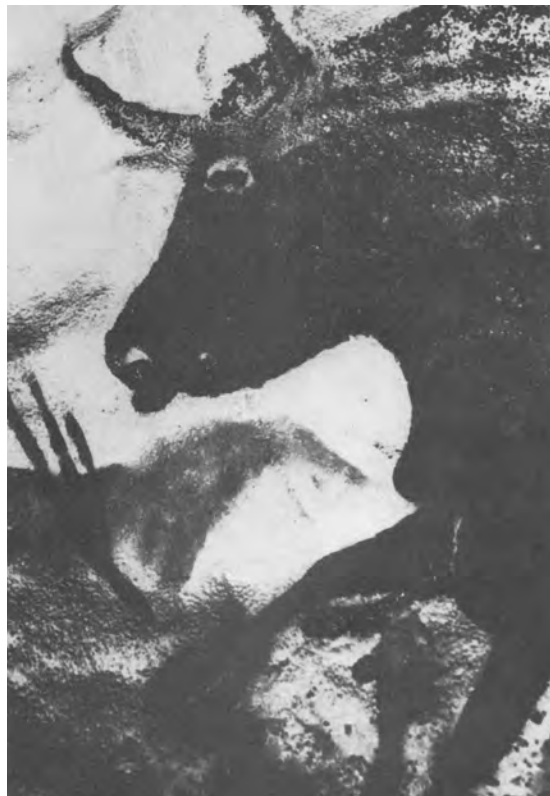
Lascaux: schwarze Kuh (Altsteinzeit)

Durch die Funde aus dieser frühesten Epoche der Menschheitsentwicklung ergibt sich ein widersprüchliches Bild.