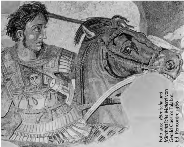
Pompeji: Ausschnitt aus der „Alexanderschlacht“ (Mosaik)

verbliebenen Mysterienstätten durch Brand zerstört. Von Aristoteles erzogen, strebte Alexander der Große danach, nicht nur ein irdisches, sondern auch ein kulturelles Weltreich zu gründen, das die Welt vom Orient zum Okzident umspannen sollte.