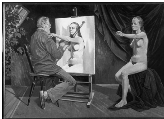
Kurt Regscek: Kleines surreales Wunder (Öl/Grisaille 1992)

Eine klassische Aporie also. Aber gibt es wirklich keinen Ausweg? Muss jeder, der beginnt, Geschichte zu studieren, gleich am Eingang zum Hörsaal resignieren? Muss ein in die Lebensjahre gekommener Mensch erkennen, dass auch er nichts erkennen wird können? Mitnichten, sage ich. Ich habe zwar nicht faustisch Physik und Philosophie studiert, dafür aber angewandte Sozialwissenschaft. Und diese rufe ich jetzt zu Hilfe (wie einst die Burschen die „Poesei gegen Zopf und Philisterei“).