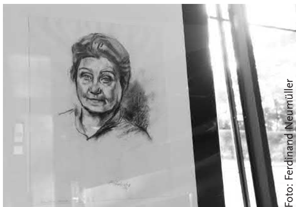
Dolores Viesèr Zeichnung von E. Wucherer (1972)

Verbunden werden die beiden Teile des Romans durch mehrere Gestalten, die auf nicht weniger sorgfältige Weise und mit demselben psychologischen Einfühlungsvermögen gezeichnet werden wie die zentralen Handlungsträger. Eine dieser Gestalten