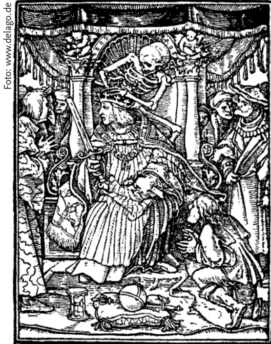
Hans Holbein d. J.: Totentanz – Der Kaiser

dig, sondern die Weltgeschichte als ein „riesiges Palimpsest, ein zusammengestoppeltes, nein, ein zu neun Zehntel verdorbenes Manuskript“ 59 betrachtet und deswegen von den unterschiedlichen „Wahrheiten“ der Historiografen spricht: „[...] was wir aus der Psychologie wissen, daß Wahrheit Schichten hat wie eine Artischocke, daß hinter jeder Wahrheit meist noch eine andere verborgen sitzt, daß es eine absolute Chronik der Seelentatsachen, ein wahrheitsgemäßes Protokoll der Geschichte nicht gibt.“ 60 Er betont: