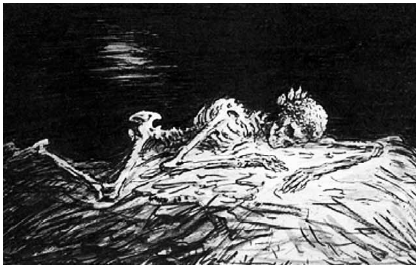
Auch Alfred Kubin zeichnete für den Simplicissimus

unfähig vegetieren sie dahin. „Einige Dezennien später“, heißt es am Ende der Erzählung, „man schreibt das Jahr 1950, bewohnt eine neue taubstumme Generation den Erdball“. Selbst die Musik eines Mozart oder Beethoven ist in dieser „tauben“ Welt zur Bedeutungslosigkeit herabgesunken. Die „Nachschrift“ des Autors lautet: „Der verehrte Leser wird gewarnt, das Wort ‚Ämälän‘ laut auszusprechen.“ (WH 3, S. 72)