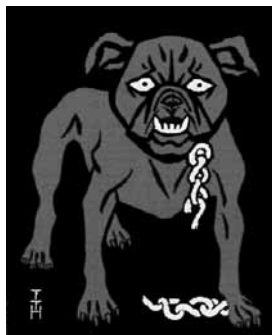
Simplicissimus-Logo von Thomas Theodor Heine

Als Meyrink, der im letzten Jahrzehnt des neunzehnten Jahrhunderts im Freundeskreis und in Prager Cafés den Ruf eines geistreichen Erzählers kurioser Geschichten genoss, 1901 seinen ersten Text, Der heiße Soldat , an den Simplicissimus schickte und bald darauf gedruckt sah, war diese 1896 vom Verleger Albert Langen vorrangig als Unterhaltungsblatt konzipierte Zeitschrift bereits zum profiliertesten Oppositionsblatt des Kaiserreichs geworden, das mit seinen Karikaturen Armee, Justiz, Kirche und Bildungsanstalten in ihren typischen Vertretern bekämpfte und dem allgemeinen Gelächter preisgab. 7