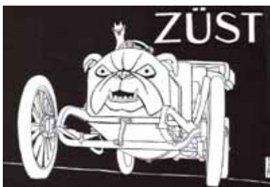
Züst-Reklame als Variation des Simplicissimus-Logos, gezeichnet von Th. Th. Heine

In dieser Spezialnummer, die der streitbare Karl Kraus als „die purste Mischung aus Impotenz und Heuchelei“ bezeichnet, taucht der Züst-Wagen nicht nur im Anzeigenteil und in Karikaturen auf, sondern auch in Meyrinks