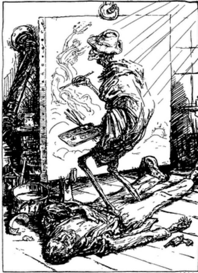
Alfred Kubin: Der Maler

So erweckt Die Weisheit des Brahmanen – Weisheit des Brahmanen ( Simplicissimus , 1907) zunächst den Eindruck, Meyrink wolle sich über die buddhistische Lehre lustig machen: Ein markerschütternder, unaufhörlicher Schrei „überweht wie grausige Botschaft“ die indische Wüste. Niemand kann seine Ursache ergründen, bis eines Tages ein Brahmane in einer Lichtung auf einen abgezehrten Büsser stößt, dessen Hand eine schwere eiserne, mit Stacheln besetzte Kugel umkrampft, „und je mehr die Finger sie preßten, um so tiefer drangen die Spitzen ins Fleisch“ (WH 2, S. 111) und entlockten ihm den heulenden Schrei. Die Erzählung endet, wie so oft bei Meyrink, mit einer Pirouette, einem Umkippen ins Grotleske. Nach langem Meditieren empfiehlt der Brahmane dem Asketen