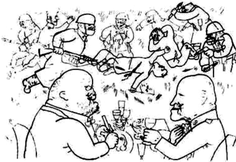
George Grosz – eine Karrikatur zum Thema „Kriegsgewinnler“

Nachkriegsära hielt das Kompensieren von Depressionen durch unsinnige Vergnügungen nämlich an – es fehlte der Glaube an die Lebensfähigkeit des zusammengeschrumpften Österreich. Obwohl noch Millionen an den bitteren Erfahrungen krankten, gaben die meisten sich schamlos dem Vergessen hin und überspielten das Vergangene mit geschwollenen Reden. Man gestand Wildgans daher einen bewundernswerten Mut zu, denn auf den Ursprung des Elends, die eigene Schuld daran, zurückzukommen, bedeutete ja den Bruch eines Tabus!