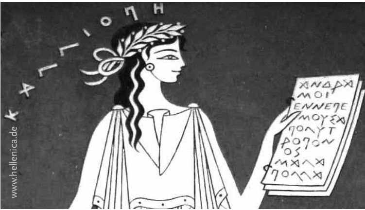
Kalliope: Die Muse der epischen Dichtung gilt als ranghöchste der Töchter von Zeus und Mnemosyne

Gedächtniskraft galt, die er vor der Erfindung der Schrift ja so notwendig brauchte. Sie wurde dann aufgespaltet in die neun von Apollo angeführten Schwestern, von denen jede eine andere Kunst vertritt. Kalliope repräsentiert die epische Dichtkunst.