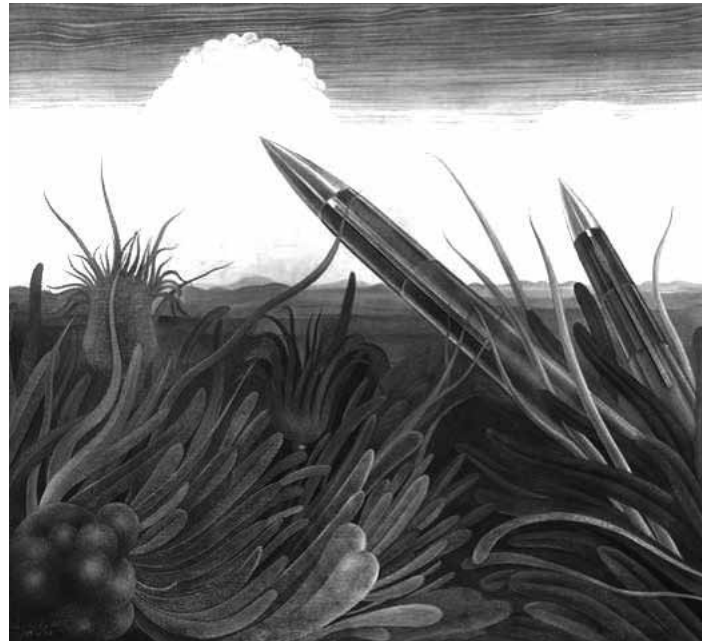
Kurt Regschek: Blumen des Todes . Aquarell 20x28 cm (1966)

Hoffnung ist eine die jeweiligen psychischen Befindlichkeiten gestaltende Kraft jenseits des Machens, die uns in einem gewissen Sinn ebenso hat wie wir sie haben. Sie ist eine arationale menschliche Neigung und (vermutlich) psychische Notwendigkeit, deren Wurzeln in unseren Erwartungshaltungen liegen. Erwartungshaltungen orientieren sich an Gewohnheiten und meinen sich durch Wiederholung bestärkt, während gleichzeitig durch eben diese Wiederholung die statistische Wahrscheinlichkeit in einem Beobach-