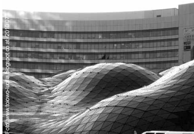
Goldene Terrassen, Warschau

Später ging man weitgehend zu „Türmen“ mit geraden Fassaden und mit großen Fensterflächen über, die als kalt und unnahbar empfunden werden. Neueste Entwicklungen zeigen aber, dass Gebäude wie das Palmenhaus ihre Vorbildfunktion wieder zurückgewinnen. Die Glas-Stahl-Konstruktionen zeigen wieder einen Rückgriff auf weiche, der Natur nachempfundene Formen. Die Dachkonstruktion Goldene Terrassen in Warschau oder die