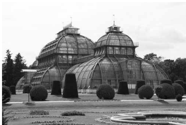
Palmenhaus im Schönbrunner Schlosspark

Später ging man weitgehend zu „Türmen“ mit geraden Fassaden und mit großen Fensterflächen über, die als kalt und unnahbar empfunden werden. Neueste Entwicklungen zeigen aber, dass Gebäude wie das Palmenhaus ihre Vorbildfunktion wieder zurückgewinnen. Die Glas-Stahl-Konstruktionen zeigen wieder einen Rückgriff auf weiche, der Natur nachempfundene Formen. Die Dachkonstruktion Goldene Terrassen in Warschau oder die