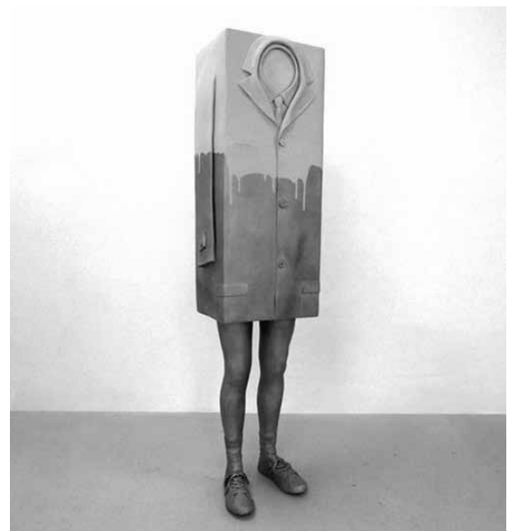
Erwin Wurm: Kastenmann

Hinter der vordergründig skurril-witzigen Oberfläche der Arbeiten verbirgt sich ein philosophisch-gesellschaftskritischer Ansatz. Das immer wiederkehrende Motiv der Kleidung in Objekten und Fotografien steht für die repräsentative soziale Hülle, für die schützende zweite Haut des Menschen und thematisiert das Gefangensein des Individuums in seinem gesellschaftlichen Kontext.