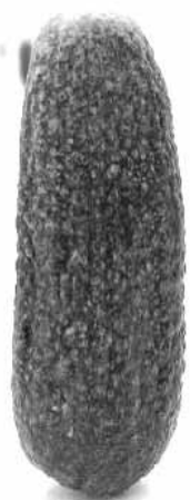
Erwin Wurm: Selbstportrait als Essiggurkerl

Skulptur gewordene Gegenstände, wie das in Österreich allseits beliebte Essiggurkerl („Selbstportrait als Essiggurkerl“, 2010), zeigen exemplarisch banale Alltagsrealitäten auf. Der Repräsentant für den Mensch ist in Wurms Arbeiten nicht mehr er selbst, sondern wie er lebt – versinnbildlicht durch sein Auto, seine Kleidung, seine Wohnung oder durch ein normales Essiggurkerl. (Günther Oberhollenzer, Kurator der Sammlung Essl) 3