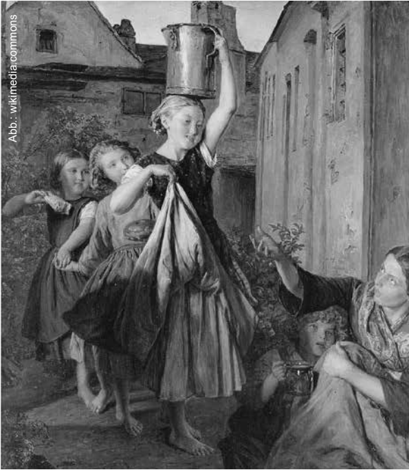
Ferdinand Waldmüller: Barmherzigkeit