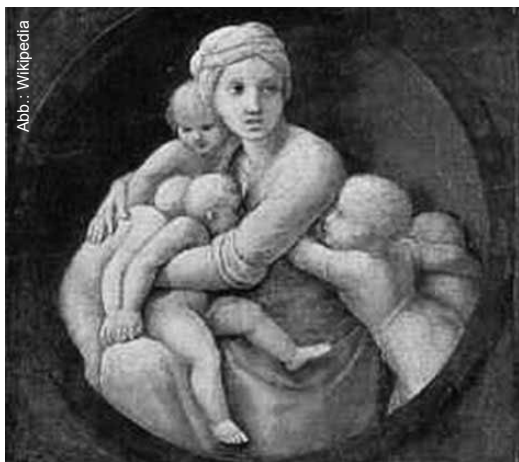
Raffaels: Allegorie der Liebe

Auch dem Menschen ist im Rahmen seiner Triebhaftigkeit diese Dialektik immanent. So diagnostiziert Charles Darwin die Zuneigung als einen biologischen Prozess, der sich über die Generationen entwickelt hat: „Da ohne Zweifel Zuneigung eine Vergnügen erregende Empfindung ist, so verursacht sie ohne Zweifel allgemein ein leichtes Lächeln und etwas Erglänzen der Augen. Ganz allgemein wird eine starke Begierde empfunden [...] Wahrscheinlich verdanken wir diese Begierde vererbter Gewohnheit in Assoziation mit dem Warten und Pflegen unserer Kinder und mit den gegenseitigen Liebkosungen Liebender.“ 6 Die Zuneigung des Menschen unterscheidet sich jedoch von der reinen Triebhaftigkeit des Tieres, da sie in Spielarten aufgefächert werden kann wie Freundschaft, Kameradschaft, Hilfsbereitschaft usf. und auch Bestand haben kann, wenn die Überlebensfrage nicht zur Disposition steht, oder gerade dann, wenn es angebracht wäre, im Sinne des Überlebens Ablehnung bzw. Aggression an ihrer Stelle zu zeigen.