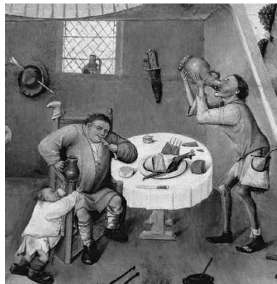
Detail aus dem Tisch der sieben Todsünden und die vier letzten Dinge (Museo del Prado)