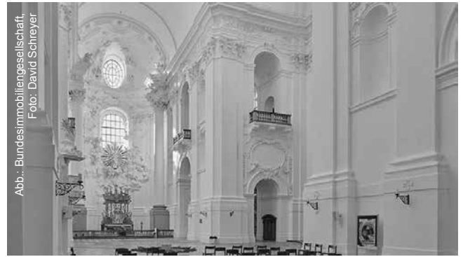
Inneres der Kollegienkirche