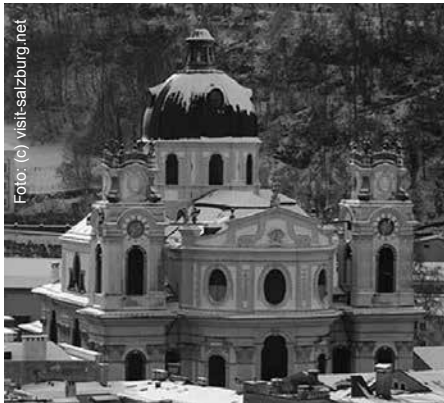
Die Kollegienkirche oder Universitätskirche

„farbloser“ und jüngst aufwendig restaurierter Sakralraum. Der Bezug zu Maria erweist sich in der Weihe an die „Immaculata“ und ihrer plastischen figuralen Darstellung im Chor der Kirche als Vision (im Wolkenwirbel vor dem großen Fenster) sowie in der diese Reinheit versinnbildlichenden Weißtönung aller Flächen.