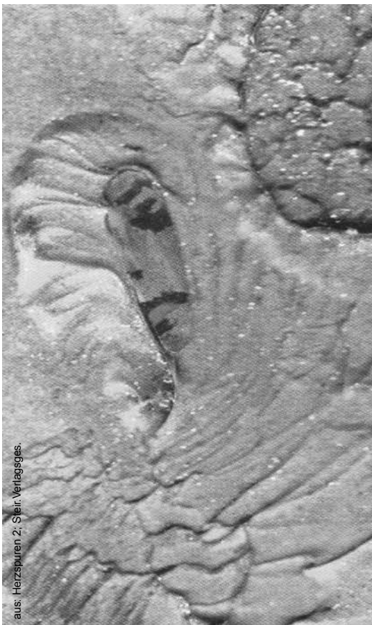
aus: Herzspuren 2, Steir. Verlagsges.

Einmal habe ich mich erkältet, hatte Kopfschmerzen, etwas Fieber und ging etwas früher ins Bett. Kurz nach Mitternacht wurde ich plötzlich wach, wie neugeboren leicht und munter, mit klaren Gedanken im Kopf. Dabei war mein Fieber sehr hoch, aber das störte mich nicht. Die Zeilen des Gedichtes haben schon einige Tage lang vor der Krankheit in meinem Kopf gewelt. Und nun standen sie vor meinen inneren Augen so fast fertig, dass ich diese nur aufschreiben sollte. Das tat ich. Danach, am hellen Tag, machte ich nur wenige Korrekturen. Es war eine Improvisation nach langsamem ruhigen Kochen in meiner „Hexenküche“.