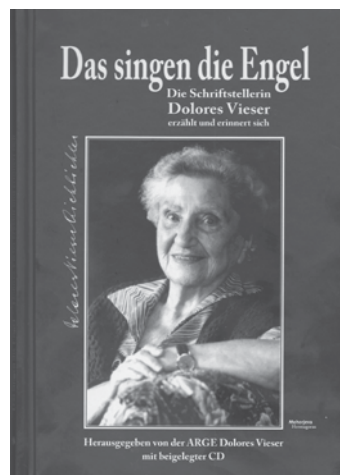
Titel des 2020 produzierten eindrucksvollen Hörbuchs