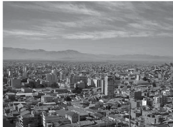
Oruro im Hochland des bolivianischen Andenmassivs.

Ein drittes Mal hatte ich soeben meinen jährlichen Urlaub angetreten und befand mich unterwegs von Potosí nach La Paz. Mein Reisegenosse war Elektroingenieur, der auf dem gleichen Bergwerk tätig war wie ich. In Oruro, dem größten Halteort auf unserer Strecke, wurden wir beide vom Zug weg verhaftet. Ein Witzbold oder Übergesinnter hatte gegen meinen Bekannten die Anzeige erhoben, dass er Nazispitzel sei und eine „Kurzwellensendeanlage“ bei sich führe. Tatsächlich hatte er ein damals in Bolivien noch höchst seltenes Tonbandgerät in seinem Gepäck. Ich musste als Begleiter dieses gemeingefährlichen Subjekts durchaus auch mit. Unsere Firma, die in Oruro eine große Niederlassung hatte, tat zwar ihr Bestes, uns zu befreien. Da es sich aber um eine so schwerwiegende Hochverratsache handelte, ließen sich die Behörden Zeit, und wir saßen mehrere Tage im Kittchen. Immerhin ließ uns die Firma Betten und das tägliche Essen hineinschaffen. Auch mein Urlaub wurde großzügigerweise um die eingebüßte Frist verlängert.