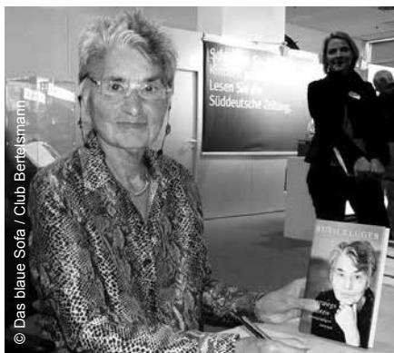
Ruth Klüger mit ihrem Buch unterwegs verloren , 2008

Was, wenn man nicht an der Seite der Mutter Verse hört, nicht gegen einen barbarisch-stampfenden Marschtritt weiche, beruhigende Worte in einem humanen Rhythmus abrufen kann, sondern stramm stehen muss in Staub und Hitze, stundenlang, ohne Gleichdenkende neben sich zu wissen: Dann ist man allein mit dem, was man im Gedächtnis hat. Wenn es Gedichte sind, die man auswendig gelernt hat und inwendig rezitieren kann, umso besser. Der Körper muss dem „Habt acht!“ gehorchen, doch innen bewirken Verse eine Bewegung.