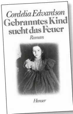
Titel des im Hanser-Verlag 1986 publizierten Buchs

sie Abtritte zu scheuern und als Bürokrant in einer Schreibstube zu arbeiten, für den berüchtigten Lagerarzt Dr. Josef Mengele.