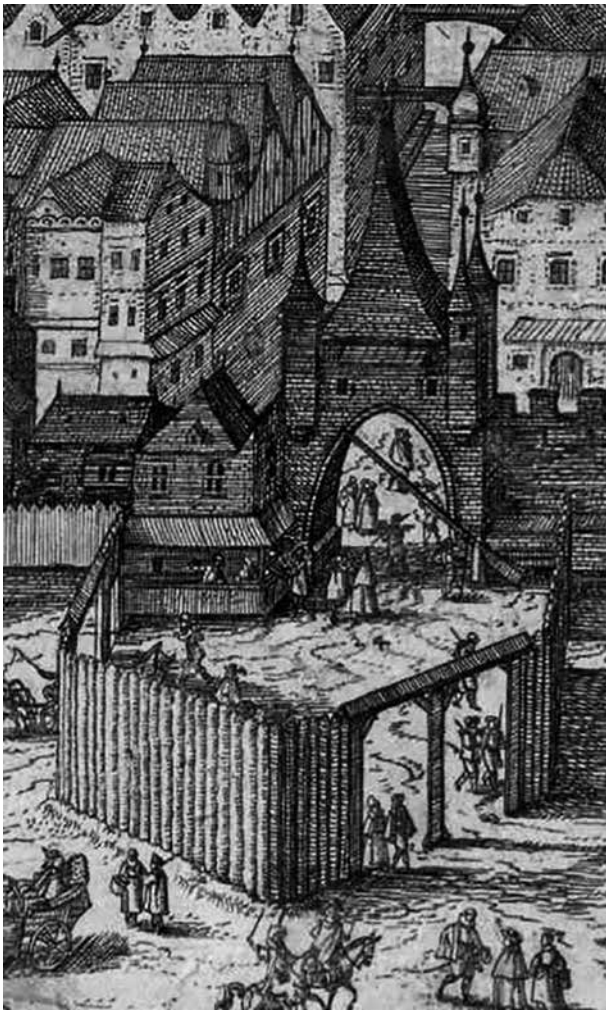
Rotenturmtor, Vogelschau von Jakob Hoefnagel, Ausschnitt, 1609.

Beim Roten Turm wurde die Wassermaut eingehoben. Ab 1662 wurden Fahr- und Gehtor getrennt. Der Rote Turm wurde 1776 abgetragen, um die Einfahrt in die Stadt zu erleichtern. Der Name Roter Turm bezieht sich nicht auf die Farbe „rot“ sondern auf das Wort „Rout“ (Recht), da sich im Roten Turm (wie auch im Kärntnerturm) ein Gefängnis befand, genauere Informationen sind leider bis heute nicht bekannt.