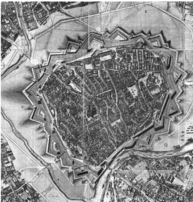
Wiener Stadtbefestigung, Vogelschauplan von Joseph Daniel von Huber, 1778

Abb.: WSLA, Kartographische Sammlung, Sammelbestand, P1: 11