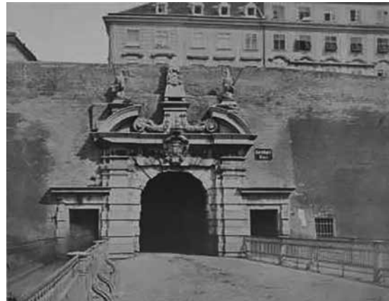
Altes Kärntner Tor von außen, um 1858

Von Franz-Josef I. wurde 1857 der Abbruch der Befestigungsanlage verordnet, damit war der erste Schritt in Richtung des heutigen Aussehens Wiens getan. Im darauffolgenden Jahr begannen die Abbrucharbeiten, nach und nach verschwanden die Befestigungsanlagen aus dem Stadtbild. 1885 begann der Bau der Ringstraße.