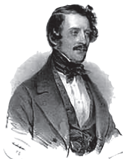
Donizetti (Joseph Kriehuber, 1842)