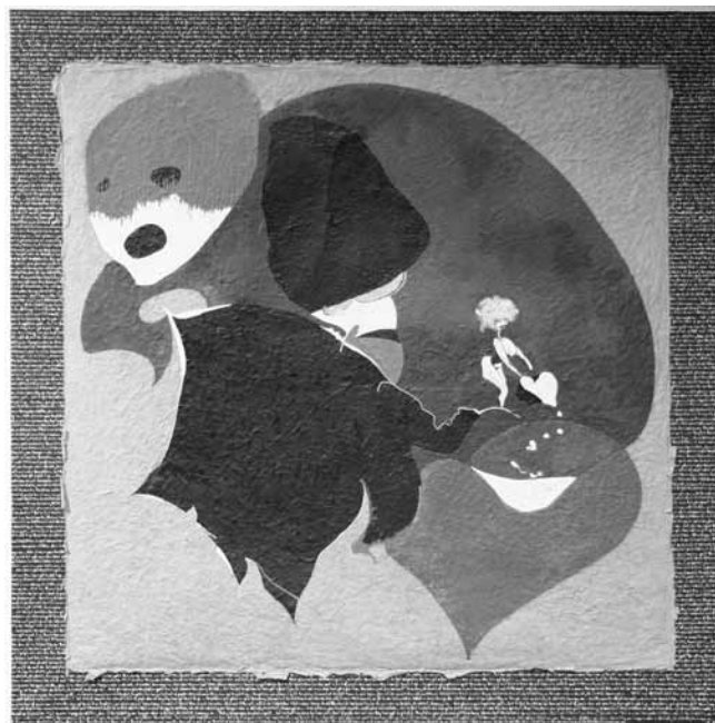
Ulli Klepalski: Wenn du mich heimsuchen willst. Öl auf Bütteln auf Leinwand auf Literatur, 120x120 cm

Im Wald höre ich von Ferne einen Knall. Dann noch einen. Es dauert lange bis ich begreife, dass es Schüsse sind. Die Jäger sind gekommen.