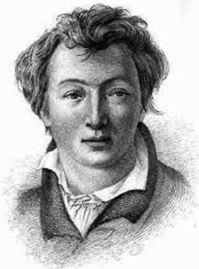
Heinrich Heine nimmt den Graf Platen aufs Korn ...

Zwei Jahre später stellte dann Karl Kraus in seiner Streitschrift Heine und die Folgen (1910) die Platen-Polemik in den Bädern von Lucca als „Antizipation“ der Harden-Eulenburg-Affäre ins Zentrum seiner moralischen Kritik an Heine. Kraus zitierte die Figur