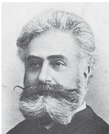
Max Nordaus Zionismus war für Heine keine Lösung seines Abstammungs-Frusts ...

Abb.: www.ludo-leuschner.de/nordau/entartung1.htm