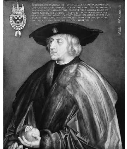
Albrecht Dürer: Maximilian I., Kaiser des Heiligen Römischen Reiches , gemalt 1519

ten Geldmangels nicht verwirklichen ließen. Indessen zeigt sich eine gründlich gelenkte und ungeachtet der zeitlichen Entwicklung erstaunliche Konsistenz. Somit war ihr trotz des weiten Spektrums, das ich im Folgenden beleuchten möchte, keineswegs der Charakter einer „Pflasterli-Politik“ eigen.