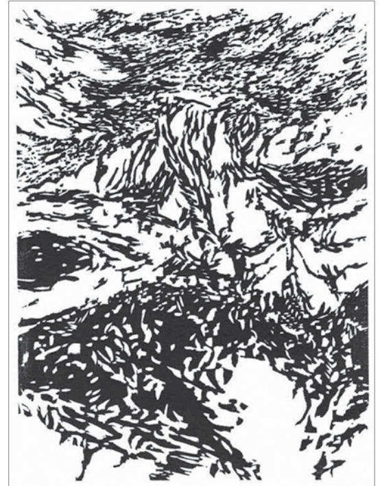
Holzchnitt von Christian Thanhäuser

Auf meiner Wange ihr Hauch: so erweht aus entfernten Gärten der Duft verwelkter Rosen, damit auf dem Mund er zum Kuss sich erhelle. Und Vorhänge östlichen Scheins, die aus reinsten Strahlen sich nährten, hängte meinen kranken Sehnsüchten sie in die Zelle.