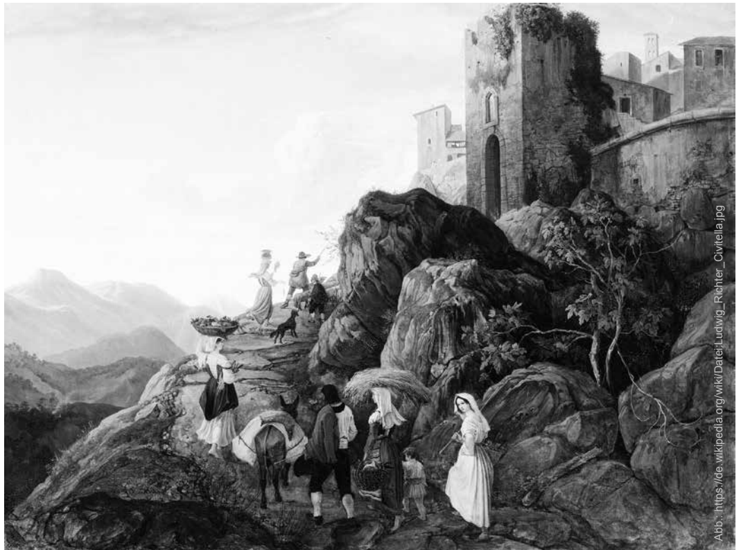
Alte Ideale, in der Romantik neu interpretiert – Ludwig Richter: Civitella (Der Morgen). Öl auf Leinwand (1827/28)

Abb.: https://de.wikipedia.org/wiki/Datei:Ludwig_Richter_Civitella.jpg