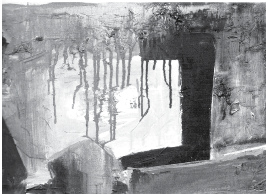
Paul Thalmann: Auf der Suche Illustration in Geborgen in Dir , 2007

aus: Noch ist das Lied nicht aus. Österreichische Poesie aus neun Jahrhunderten. Hg. v. Ulrich Weinzierl, Residenz Verlag 1995, S 149