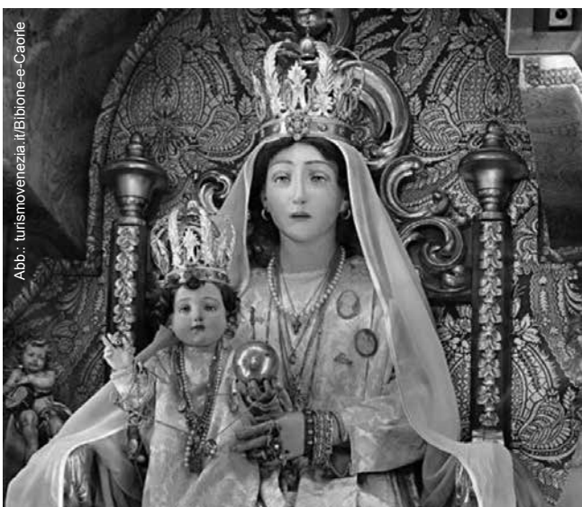
Die Madonna dell' Angelo in Caorle wird auch als „Santa Maria stella di mare“ besungen – den Text und die Übersetzung von Erika Mitterer finden Sie anschließend an diesen Beitrag.

Der Abendhimmel blau und ausgewaschen, die Schwalben schwirren ihrer Beute nach. Erneut durchdringt der Blick das Wolkenband: die Hohe Frau taucht wieder auf mit ausgestreckten Flatterarmen [...] Ihr Kleid schleift nach. Sie fährt mit weitem Schritt wie hingezogen Elisabeth entgegen & umschlingt die Base. Magnificat , hochpreiset meine Seele unsern Herrn. Still flüstere ich ein Gracias . (Auszug aus Marietag in Die Quadratur der Sinne , S. 10, 2019)