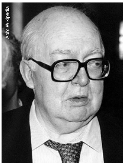
Friedrich Reinhold Dürrenmatt (5.1.1921 – 14.12.1990) bei der Verleihung des Ernst-Robert-Curtius-Preises für Essayistik 1989 in Bonn

Das Titel-Zitat stammt aus Die Physiker und müsste für diesen Essay eigentlich mit einem großen Fragezeichen versehen werden 1 . In konträrer Attitüde überlegte das St. Galler Tagblatt zu Beginn der Gedenkwochen auf seiner November-App., „... warum er immer noch beunruhigt und inspiriert“. Die publizistischen Würdigungen überschlugen sich, nicht nur zum 100. Geburtstag, sondern überdies zum 30. Todestag am vergangenen 14. Dezember. Macht es Sinn, diesem ernsthaften Potpourri noch etwas hinzuzufügen? Oder anders: Es kann wohl nur um eine persönliche Sicht gehen; deshalb zuerst meine Erinnerungen: