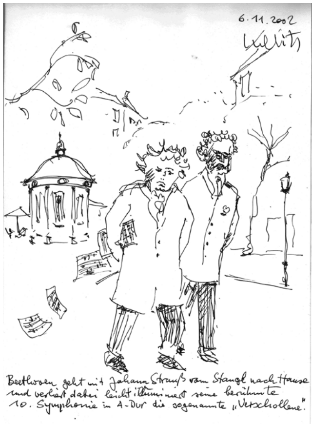
Beethoven geht mit Johann Strauß vom Stangl nach Hause und verliert dabei leicht illuminiert seine berühmte 10. Symphonie in A-Dur die sogenannte „Verschollene“.