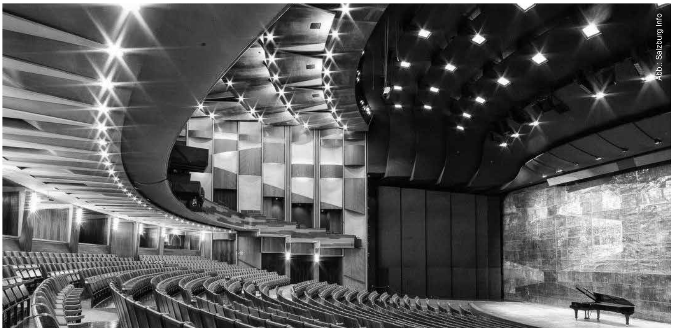
Zuschauerraum und Bühne des großen Festspielhauses in Salzburg

Mit dem Bau des weltweit ersten Wellnesshotels in Deutsch Altenburg, dem ersten Maisonettenhaus Österreichs in Wien, der Revitalisierung des Palais Schlick, mit Krankenhausprojekten im Iran gemeinsam mit Professor