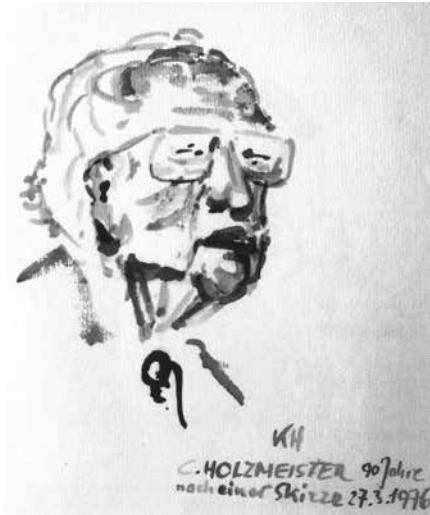
Hans Krebitz: Porträt Clemens Holzmeisters, Aquarell nach einer Skizze, 1976

Fellinger und der Errichtung von US-Botschaften im Ostblock wurde er auch international bekannt; sein Projekt einer auf der Spitze stehenden Pyramide in Kairo konnte schlussendlich aufgrund der sich ändernden politischen Situation nicht verwirklicht werden.