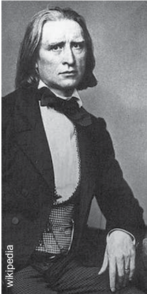
Franz Liszt, 46-jährig

Obwohl Liszt in dieser Zeit einen ganz entscheidenden Einfluss auf seinen jungen Freund ausübt, findet Cornelius doch immer mehr zu einer eigenen künstlerischen Sprache und lässt sich nicht so leicht von seiner Fährte abbringen, unterwirft sich daher nicht blindlings jedem Ratschlag seines Mentors. Liszt sieht nämlich die schöpferische Zukunft seines Freundes zunächst in der geistlichen, kirchlichen Musik. Doch Cornelius schwebt in einer ganz anderen Gattung Großes vor.